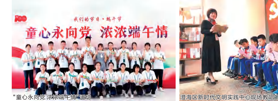
“童心向党 浓浓端午情”活动