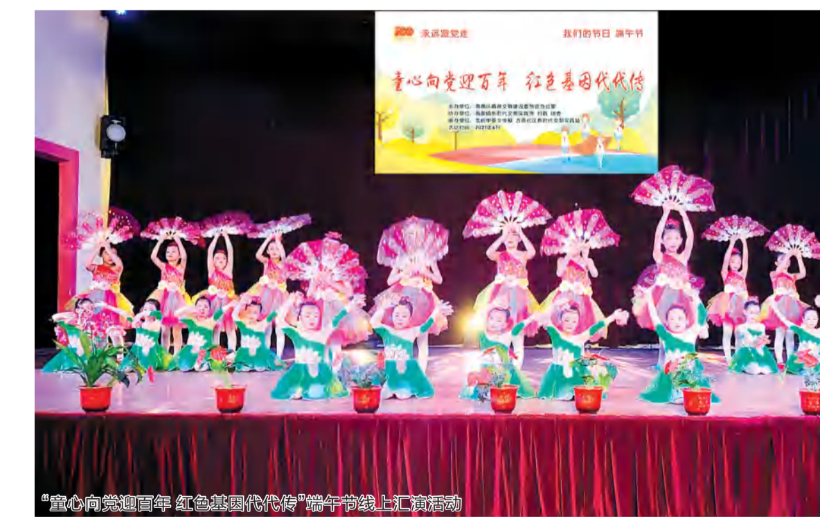
“童心向党迎百年 红色基因代代传”端午佳节线上汇演活动

今年以来,汕头各行各业开展各类主题鲜明的文明创建活动332场次,在助力脱贫攻坚、帮扶文明创建、提供便民服务等方面发挥了重要作用,群众满意度达100%。