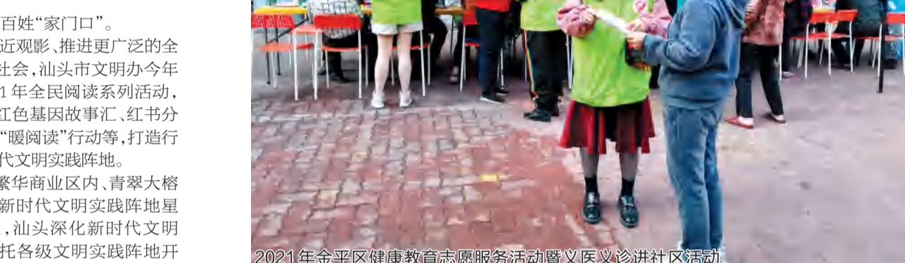
2021年金平区健康教育志愿服务暨义诊进社区活动

除了用好乡村“复兴少年宫”为孩子们提供更多阅读机会外,今年以来,澄海区还充分利用农家书屋主阵地,举办阅读分享会、村史大家讲等活动,用好用活农家书屋这一党史学习教育重要载体,推动党史学习教育与全民阅读有机结合。