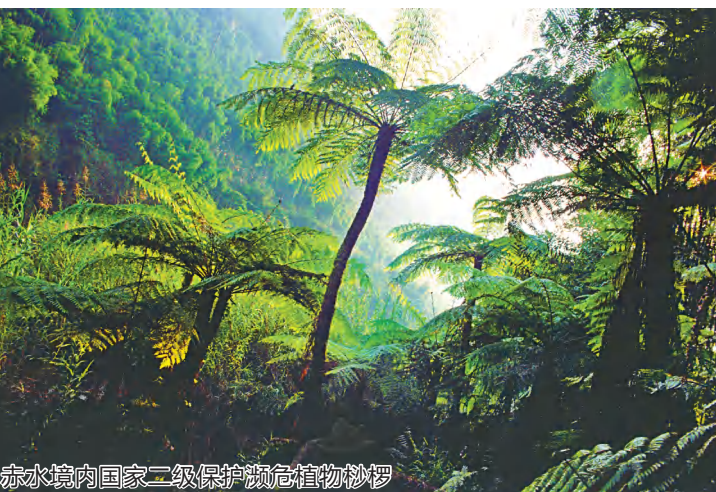
赤水境内国家二级保护濒危植物桫欏

全市上下将在党的二十大精神指引下,在省委、省政府和遵义市委、市政府的坚强领导下,树立志在必得的决心,咬定目标不放松,以“十无一讲一创”奋力争创全国文明城市,为“努力打造赤水河流域共同富裕先行区、奋力开创百姓富生态美产业强的现代化赤水新未来”增添鲜明的文明底色,贡献更大的智慧力量。