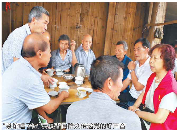
“茶馆嗑子匠”志愿者们向群众传递党的好声音