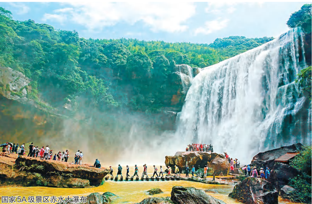
国家5A级景区赤水大瀑布