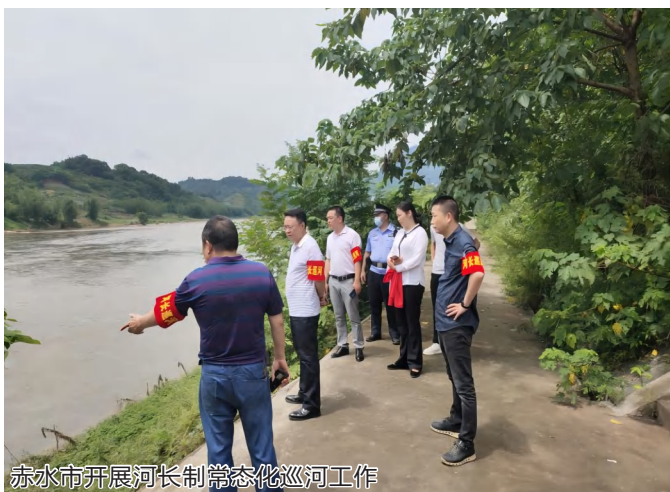
赤水市开展河长制常态化巡河工作