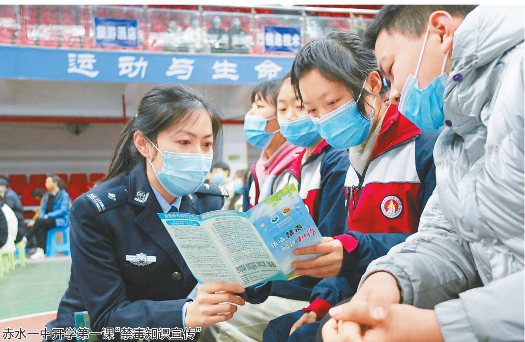
赤水一中开学第一课“禁毒知识宣传”

贵州赤水,地处黔北遵义与川南泸州交界,历为川黔边贸纽带、经济文化重镇,是黔北通往巴蜀的重要门户,素有“川黔锁钥”“黔北边城”之称。她因奔腾豪迈的赤水河而得名;因中国工农红军“四渡赤水”而闻名;因丹霞地貌荣膺世界自然遗产而驰名。