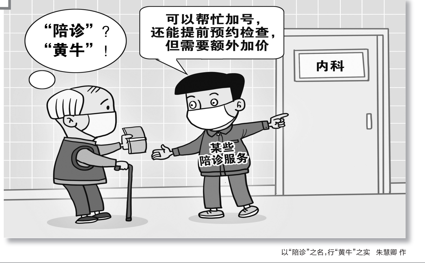
以“陪诊”之名，行“黄牛”之实 朱慧卿作

针对游戏陪玩服务建立玩家评价机制，让玩家对游戏陪玩服务进行评价和打分，并要提交相应证据，避免发生“刷好评”“刷单”等情况，从而使优质服务得到更多认可和推广，实现优胜劣汰。加强对游戏陪玩的宣传和推广，引导提高网友对游戏陪玩的认识和了解，增强消费者的权益保护意识。