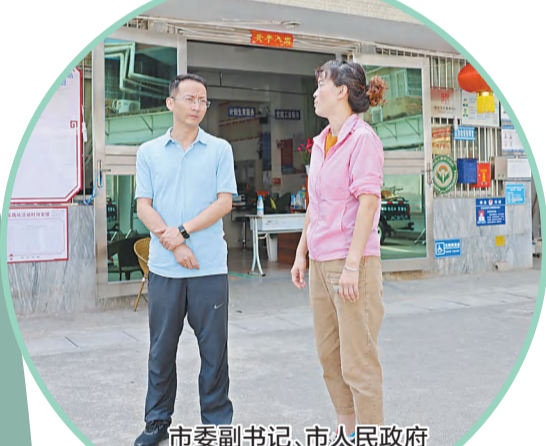
市委副书记、市人民政府市长解凌云（左1）到临江社区实地调研创建工作开展情况。