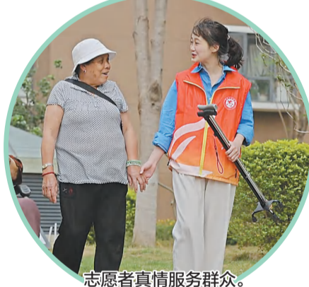
志愿者真情服务群众。