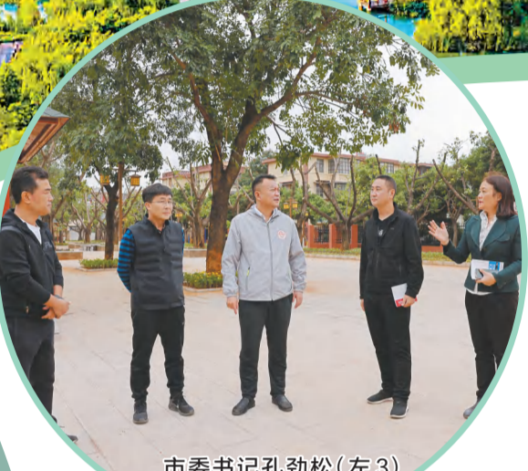
市委书记孔劲松（左3）到星光社区实地调研创建工作开展情况。

今天的开远市，400余座村庄在变美的道路上奋力奔跑，处处生机勃勃，一幅幅产业兴旺、生态宜居、乡风文明、治理有效、生活富裕的美丽乡村画卷徐徐展开，村民幸福感、获得感、满意度不断提升。