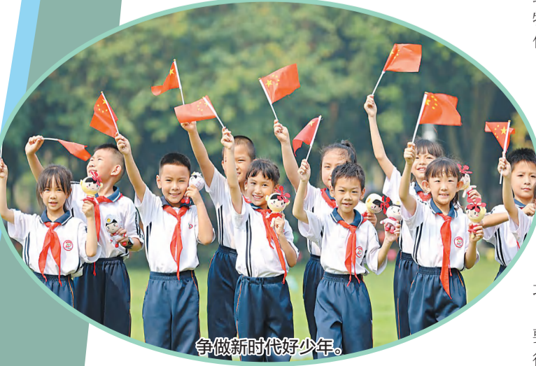
争做新时代好少年。