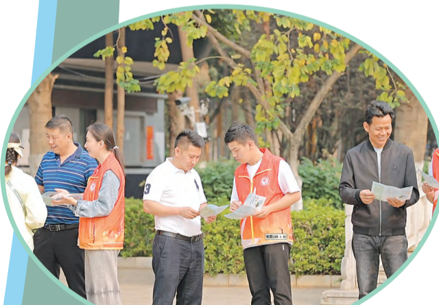
志愿服务“遍地开花”。