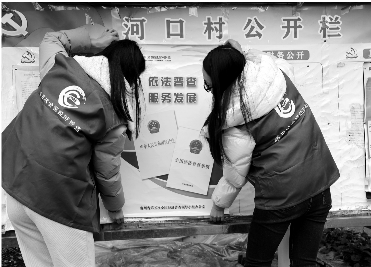
1月3日，贵州省锦屏县按照“依法普查、科学普查、为民普查”的要求，全社会动员、全方位宣传、精细化采集，同时抽调党员年轻干部担任普查指导员和普查员，扎实推进第五次全国经济普查，助力国民经济“探底”。图为当日，普查员在张贴宣传海报。

据了解，1012工作面走向长度5523米，可采长度4836米，平均煤层厚度2.2米，切眼长度350米，工作面可采煤量为520.2万吨。为推动巷道贯通工作落地见效，该矿“锁定目标、倒排工期、精心协调、高效组织，积极解决施工中遇到的各种困难，严格落实“一条巷道、一本规程、多种安全技术措施”，并根据现场作业条件及时补充完善，加强对顶板离层仪的监测，严格执行掘进超前探测要求，提前探明前方地质构造异常情况，提前采取应对措施。