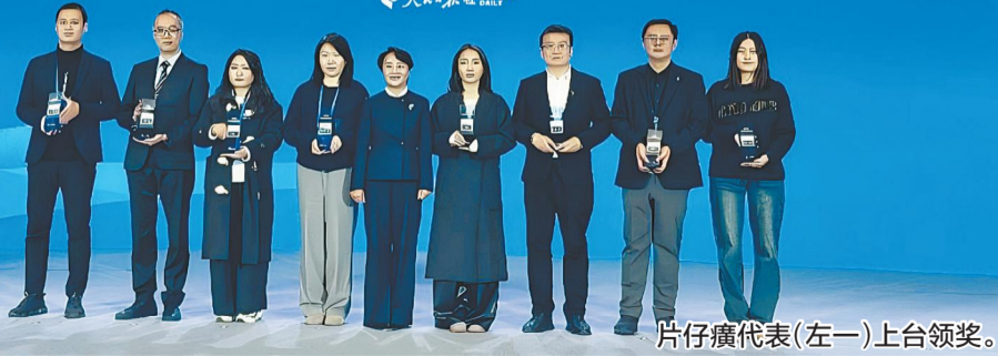
片仔癀代表(左一)上台领奖。

近日,2024中国品牌论坛在北京举行。中央和国家机关有关部委负责同志、地方政府主管部门代表、企业负责人和专家学者等齐聚一堂,围绕“发展新质生产力 推动品牌强国建设”的主题共话品牌,为推进中国式现代化贡献智慧力量。