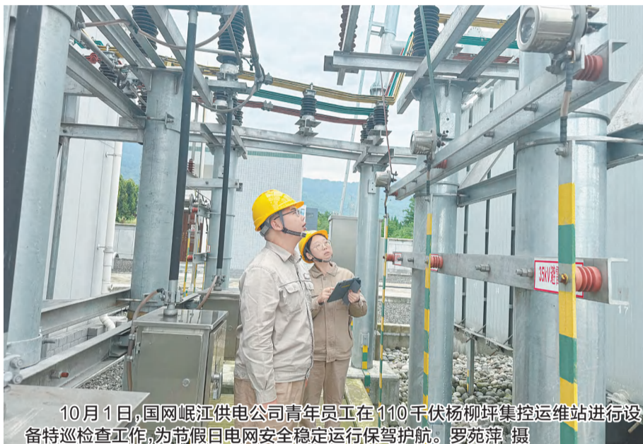
10月1日,国网岷江供电公司青年员工在110千伏杨柳坪集控运维站进行设备特巡检查工作,为节假日电网安全稳定运行保驾护航。

文化塑造品质,文明引领风尚。公司将坚持以习近平新时代中国特色社会主义思想为指导,紧紧围绕建设现代双一流发展目标,按下“现代”启动键、迈出“一流”新步伐,高标站位、狠抓落实,不断提升精神文明建设水平,为推动经济社会跨越发展、开创“两个文明”建设工作新局面、全面推进中国式现代化赋能贡献。