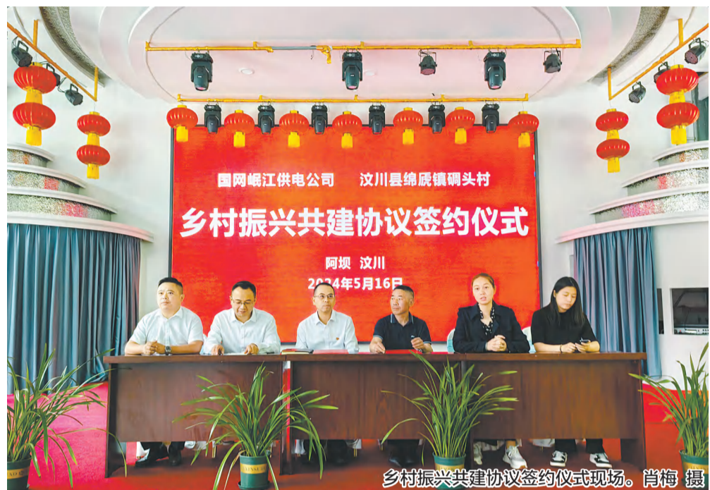
乡村振兴共建协议签约仪式现场。

近年来,国网四川岷江供电有限责任公司(以下简称“公司”)深入学习贯彻习近平新时代中国特色社会主义思想,致力于满足人民群众日益增长的美好生活用电需求和完成服务地方经济发展大局的中心任务,严格按照国网公司党组和国网四川省电力公司党委的统一部署,深入培育和践行社会主义核心价值观,充分发挥基层党组织的战斗堡垒作用和党员的先锋模范作用,在不断完善文明创建体系、创新文明创建内容、拓展文明创建阵地的过程中,全体干部职工上下同心、真抓实干,推动文明创建与业务工作协调发展,实现企业综合实力和员工整体素质稳步提升。