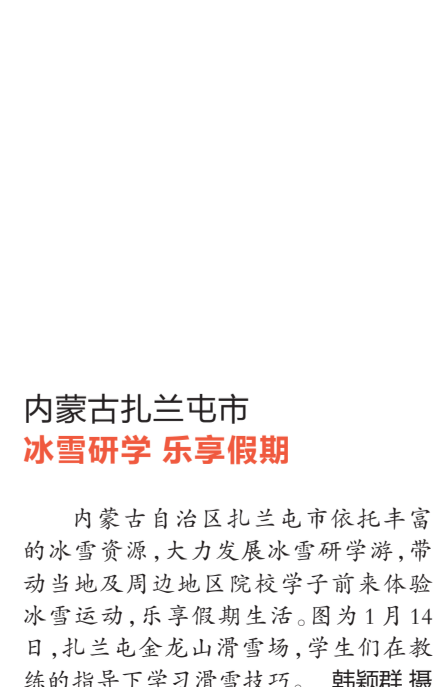
内蒙古扎兰屯市 冰雪研学 乐享假期

寒假期间,安徽省芜湖市繁昌区教育部门依托当地足球协会、足球俱乐部等举办少儿足球训练营,引导学生加强体育锻炼,提高学生体质和运动技能,让学生在运动中健康快乐成长。图为1月15日,在繁昌四中足球场上,学生在教练的指导下进行足球训练。