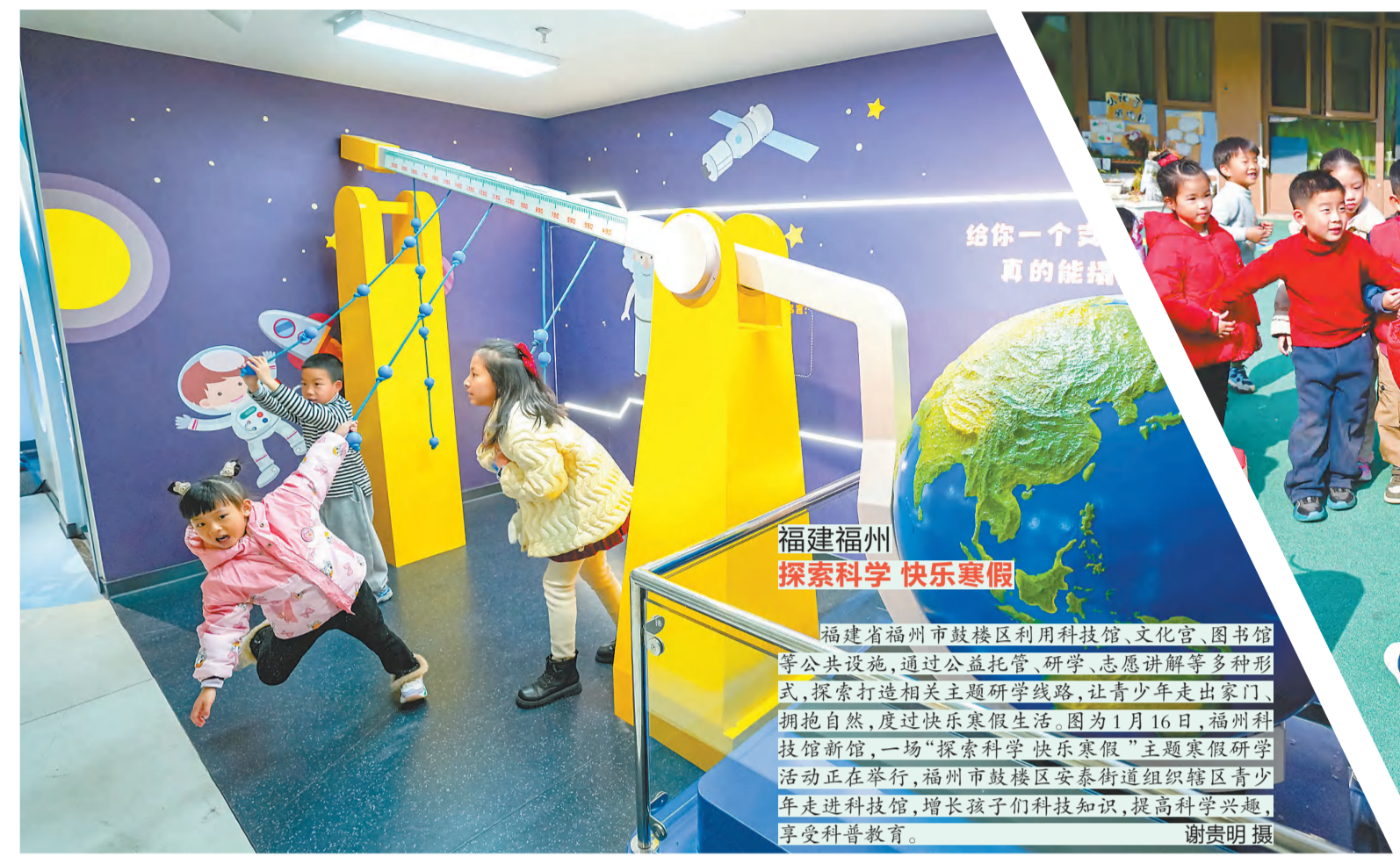
福建福州 探索科学 快乐寒假

寒假,不仅是学习征途中的休憩驿站,更是心灵茁壮成长的加速器;不仅是放松与欢笑的美好时光,更是青少年悦享成长、尽情绽放自我的璀璨舞台。本期,我们与各地陆续进入美好假期的青少年共赴冰雪盛宴、参与体育运动、学习科学知识、沉浸民俗风情……在欢声笑语中汲取知识的力量,在探索实践中见证成长的足迹,在缤纷假期中悦享成长。