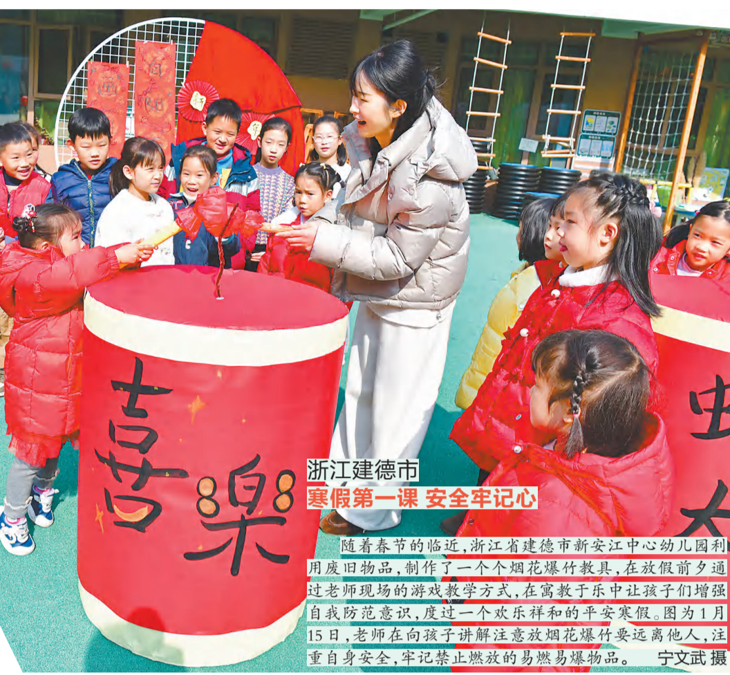
浙江建德市 寒假第一课 安全牢记心

福建省福州市鼓楼区利用科技馆、文化宫、图书馆等公共设施,通过公益托管、研学、志愿讲解等多种形式,探索打造相关主题研学线路,让青少年走出家门、拥抱自然,度过快乐寒假生活。图为1月16日,福州科技馆新馆,一场“探索科学 快乐寒假”主题寒假研学活动正在举行,福州市鼓楼区安泰街道组织辖区青少年走进科技馆,增长孩子们科技知识,提高科学兴趣,享受科普教育。