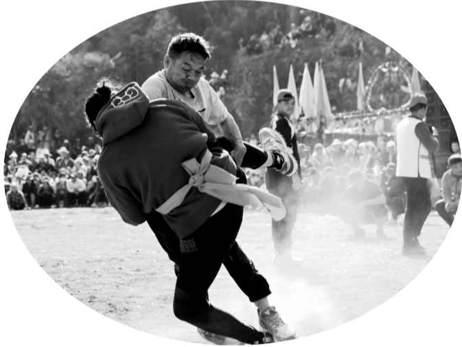
近日，云南省红河哈尼族彝族自治州弥勒市西一镇中和村委会中和铺村小组举办了“乡村振兴”亮化工程典礼暨“红色乡村杯”彝族摔跤运动会，比赛现场精彩纷呈，以民族体育文化助推乡村振兴，丰富了群众精神文化生活。图为活动现场。